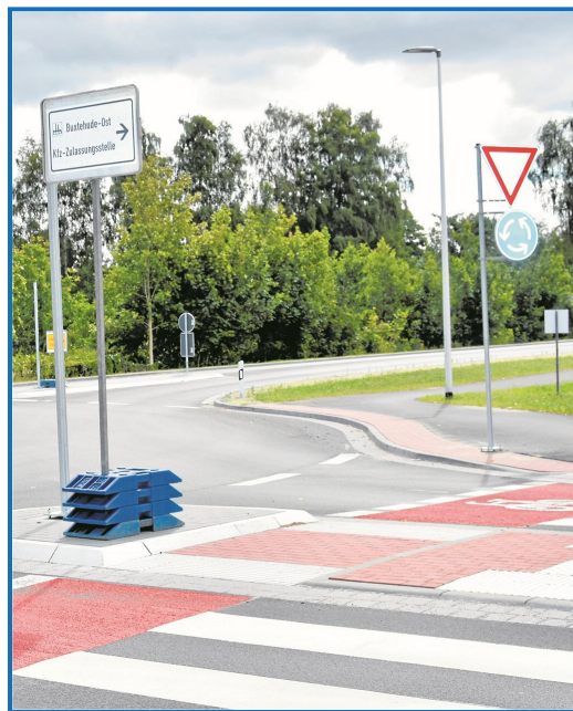
Zebrastrifen mit separater Fahrradspur – auch die Peripherie des neuen Kreisels macht einen guten Eindruck.