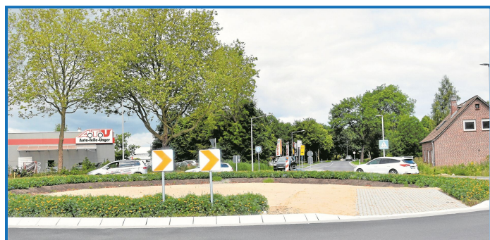
Erst das Funktionale, dann die Kunst: Der Innenkreis soll noch mit einer stählernen Skulptur des „Buxtehuder Bullen“ aufgewertet werden.

Der Mittelkreis soll mit einer Skulptur des „Buxtehuder Bullen“ aus Corten-Stahl – in einer der Kogge ähnlichen Art und Weise – gestaltet werden.